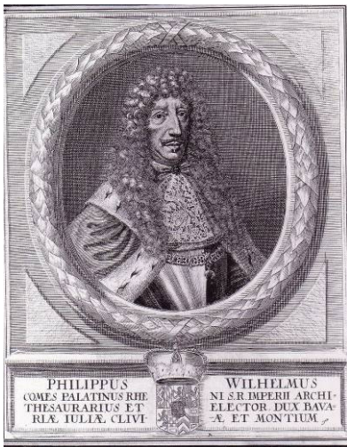
Abb. 15: Sein Vater Philipp Wilhelm (1605-1690)