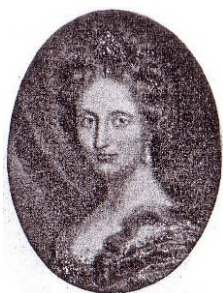
Abb. 22: Eleonore Magdalena ( 1655-1720) 32 Gemahlin von Kaiser Leopold I.