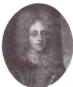
Abb. 28: Franz Ludwig (1664-1732) Fürstbischof - Hoch- meister - Fürstpropst - Kurfürst