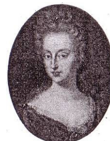
Abb. 31: Maria Anna (1667-1740) Königin von Spanien