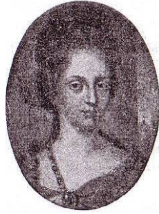
Abb. 33: Dorothea Sophia (1670-1748) Herzogin in Parma