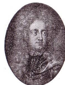
Abb. 23: Johann Wilhelm (1658-1716) Kurfürst von der Pfalz

Bei allen Medaillons © Bayerisches Nationalmuseum (BNM)