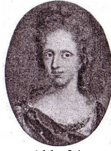
Abb. 34: Hedwig Elisabeth (1673-1722) Gemahlin des polnischen Prinzen Jakob Sobieski