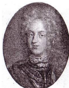
Abb. 26: Karl III. Philipp (1661-1742) General- Kaiser- licher Gubernator - Kurfürst