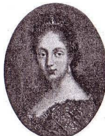
Abb. 30: Maria Sophia (1666-1699) Königin von Portugal