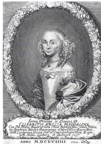
Abb. 16: Seine Mutter Elisabeth Amalie (1635-1709) im Jahr 1660

Franz Ludwig wird auf dem herzoglichen Schloss zu Neuburg an der Donau als 6. Sohn (und 9. Kind) des Pfalzgrafen und Herzogs Philipp Wilhelm von Pfalz-Neuburg 4 und seiner zweiten Gemahlin Elisabeth Amalie von Hessen-Darmstadt geboren.