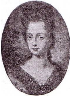
Abb. 35: Leopoldine Eleonore (1679-1693) Braut des bayerischen Kurfürsten Max. II. Emanuel