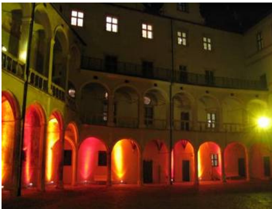
Abb. 11: Das Neuburger Schloss in Lichteffekten anlässlich der Museumsnacht