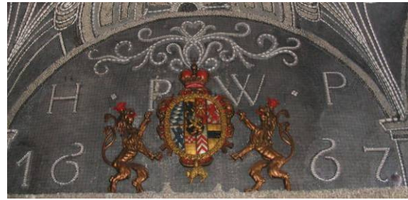
Abb. 10: Wappen von Philipp Wilhelm, dem Vater von Franz Ludwig, in den Grotten