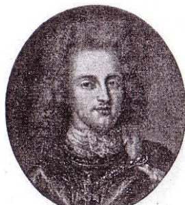
Abb. 25: Ludwig Anton (1660-1694) General – Fürstpropst - Hochmeister- Bischof